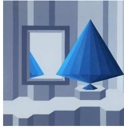
Lucio Saffaro, Lo specchio di Vermeer (opus CCLXXIII) 1987, olio su tela, 60x50 cm., Coll.Fondazione Saffaro, Bologna .Per gentile concessione della Fondazione Saffaro, Bologna http://www.fondazioneeluciosaffaro.it/

Quando si parla di Matematica, dalla scuola primaria ai corsi universitari, alla vita di ogni giorno, si pensa anzitutto al calcolo: dalle tabelline, alle equazioni differenziali, ai “modelli” matematici.