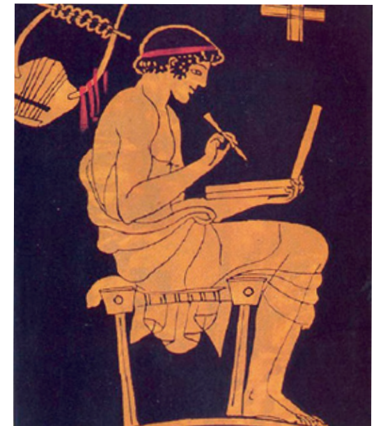
Giovane pensatore greco con PC?

Settimo Festival della Filosofia del progetto dei Giovani Pensatori